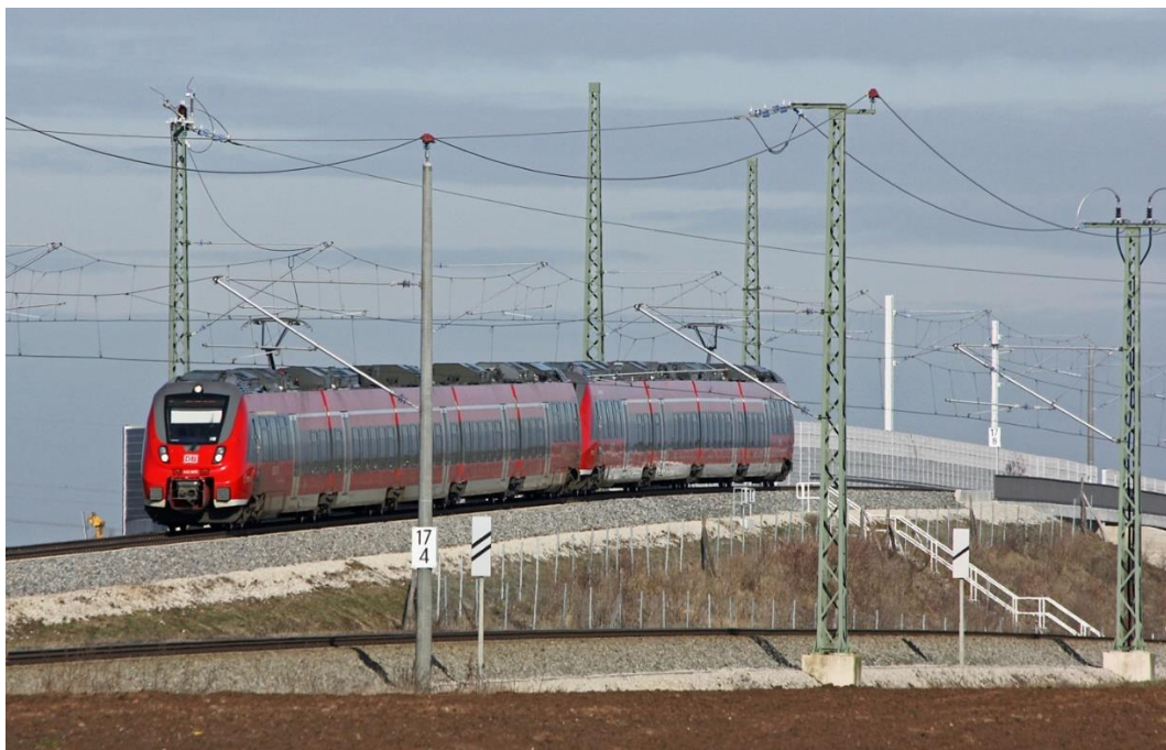
Abb. 3: Überwerfungsbauwerk bei Eltersdorf.

Zur Visualisierung des Bauwerks (Abb. 2): Externer Link